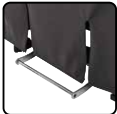
Trolleyfunctie (enkel 160kg serie).