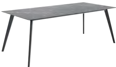
Lineto Eettafel Ruimte tussen poten ca. L180xB90xH77 140 10403423 L220xB100xH77 180 10403424

Hoogte vanaf grond tot onderkant regel bij eettafels is 75.