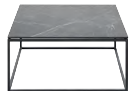
Lineto Salontafel vierkant L55xB55xH37 10424532 L85xB85xH37 10424533

OPEN VAK VOORZIE VAN RONDE OPENING VOOR KABELDOORVOER