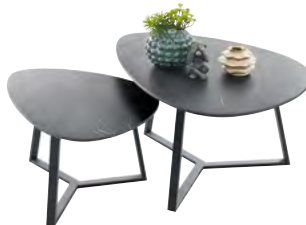
Lineto Salontafel organisch L61xB47xH37 10403425 L80xB64xH43 10403426