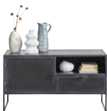
TV-meubel 1 deur, 1 lade, 1 vak H56xB101xD40 Maat open vak: H17xB48

OPEN VAK VOORZIE VAN RONDE OPENING VOOR KABELDOORVOER