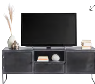
TV-meubel 2 deuren, 1 lade, 1 vak H56xB151xD40 Maat open vak: H17xB48