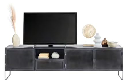
TV-meubel 3 deuren, 1 lade, 1 vak H56xB201xD40 Maat open vak: H17xB48