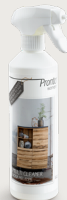
Multi Cleaner 10214095