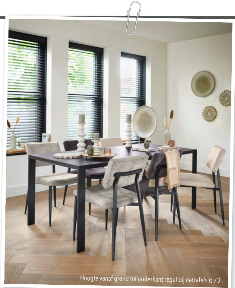
Hoogte vanaf grond tot onderkant regel bij eettafels is 73 .

Nero is een trendy woonprogramma met een industriële uitstraling. De mooie warme kleur Noir Decor en het zwart metalen frame zorgen voor een unieke sfeer in je woonkamer. Alle laden & deuren zijn voorzien van een softclose systeem.