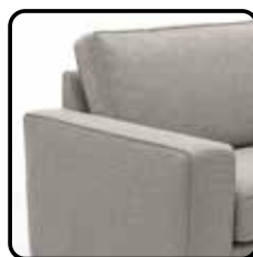
Arm D 17cm H=63 / B=17 / D=94 cm