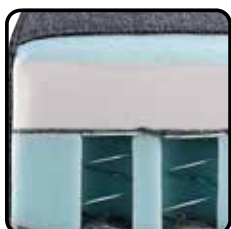
Variant 3: bonellvering i.c.m. HR-schuim (optie) Nosagveren, onderlaag bonellvering, bovenlaag HR-schuim 38kg/m 3 , diolenwatten afdeklaag