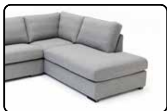
Hoek met eiland links/rechts

Bij sommige elementen kan, afhankelijk van de constructie, een extra stiknaad in de stoffering en/of optisch een extra zitkussen voorkomen. Dit verschilt per model. Op onderstaande foto's is te zien of en waar dit bij dit model het geval is.