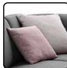
Sierkussens in dezelfde of een bijpassende stof of kleur.