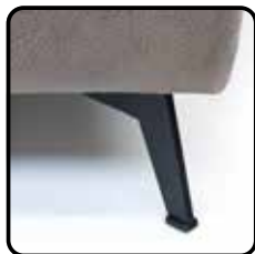
MF3 H12cm MF4 H15cm