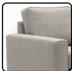
Arm B 17cm H=63 / B=17 / D=94 cm