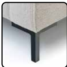
MF1 H12cm MF2 H15cm

Model Totham wordt uitgevoerd met zwart metalen poten, hoogte 12 of 15cm. Er kan gekozen worden uit twee verschillende typen poten.