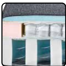
Variant 4: pocketvering op bonellvering i.c.m. Viscoschuim (optie) Nosagveren, onderlaag pocketvering op bonellvering, bovenlaag Viscoschuim 38kg/m 3 , diolenwatten afdeklaag