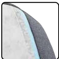
Variant 2: soft (optie) HR-schuim 30kg/m 3 , rugmat (veren en siliconen)