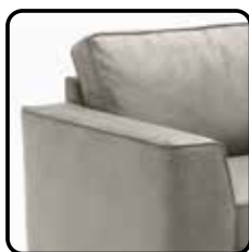
Arm A 22cm H=63 / B=22 / D=94 cm