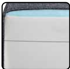
Variant 2: sandwich veerkrachtig HR-schuim (optie) Nosagveren, onderlaag HR-schuim 38kg/m 3 , bovenlaag HR-schuim 30kg/m 3 , diolenwatten afdeklaag