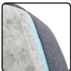
Variant 1: firm (standaard) Mix van siliconen en gesneden polyether