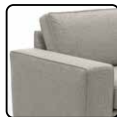
Arm E 22cm H=59 / B=22 / D=94 cm