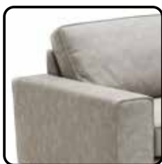
Arm C 22cm H=59 / B=22 / D=94 cm