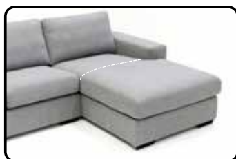
Longchair arm links/rechts