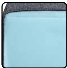
Variant 1: hoogwaardig polyether (standaard) Nosagveren, polyether 30kg/m 3 , diolenwatten afdeklaag