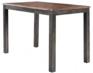
Bartafel L140xB80xH90 Hoogte vanaf grond tot onderkant regel ca. 80