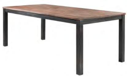
Eettafel L220xB100xH78 Hoogte vanaf grond tot onderkant regel ca. 68