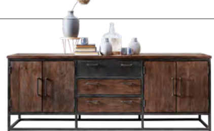
Dressoir 4 deuren, 3 laden H81xB220xD43