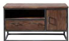
TV-meubel 1 deur, 1 lade, 1 vak H60xB112xD43 Maat open vak: H18xB73xD42

OPEN VAK VOORZIEN VAN RONDE OPENING VOOR KABELDOORVOER