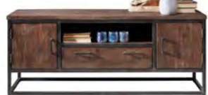
TV-meubel 2 deuren, 1 lade, 1 vak H60xB150xD43 Maat open vak: H18xB73xD42