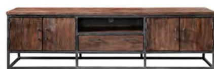
TV-meubel 4 deuren, 1 lade, 1 vak H60xB220xD43 Maat open vak: H18xB73xD42