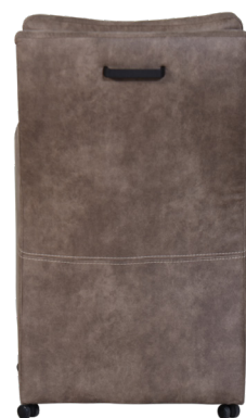
Eetkamerstoel met parketwiel H90 x B60 x D70